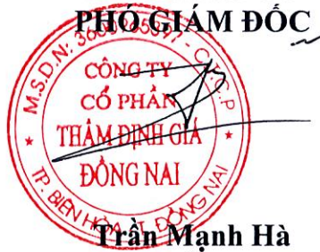
Trần Mạnh Hà Thẻ TĐV số: IX14.1101